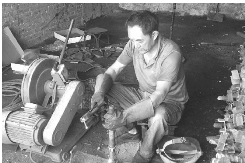
工人师傅正在进行作业

现如今,一幢幢拔地而起的高楼到处可见,很多已成为我们这个城市的地标性建筑,有的甚至成为一座城市的现代化象征。而这,是离不开挥洒着辛勤汗水的建筑工人师傅的。有这样一群人,他们是负责建筑施工企业周转材料运转的筑工人,材料管理的好坏直接影响着施工企业的正常周转,甚至整个施工项目的成本和效益。在这样的炎炎天气里,记者走近这些建筑工人师傅们,看看他们一天下来是如何辛苦工作的。