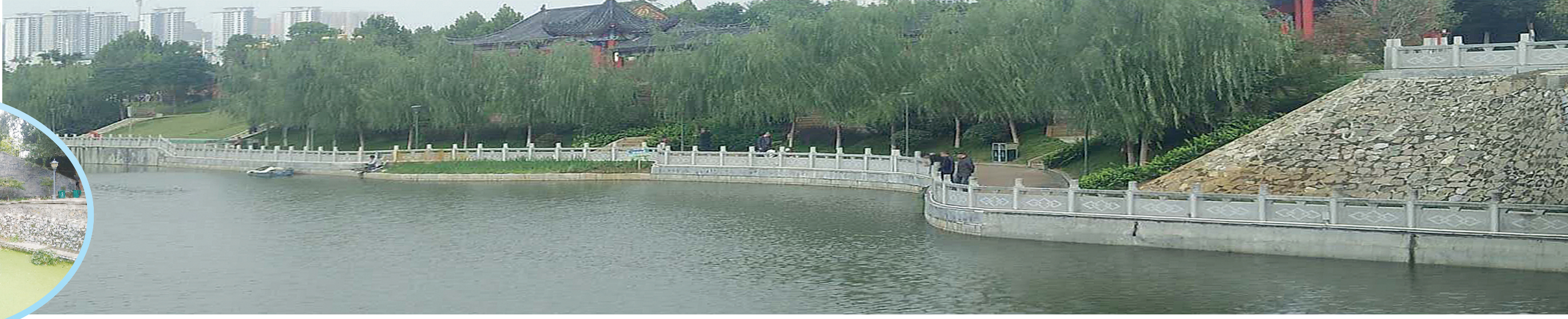
温凉河畔,美不胜收