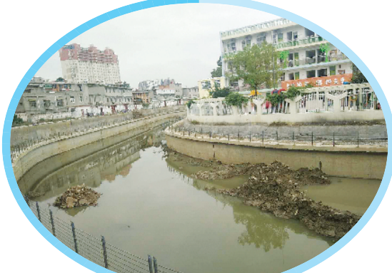
安装有护栏的梅溪河初现治理成果