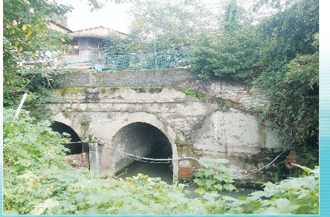
菜市场闸口桥曾为明清护城河闸口处