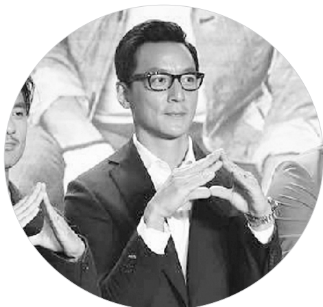
吴彦祖在《漂亮的房子》发布会上