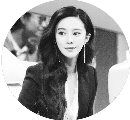
范冰冰在《超凡魔术师》中