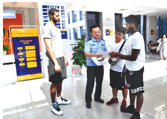
民警现场讲解有关法律条文

活动未经备案的,不得在中国境内开展或者变相开展活动,不得委托、资助或者变相委托、资助中国境内任何单位和个人在中国境内开展活动。