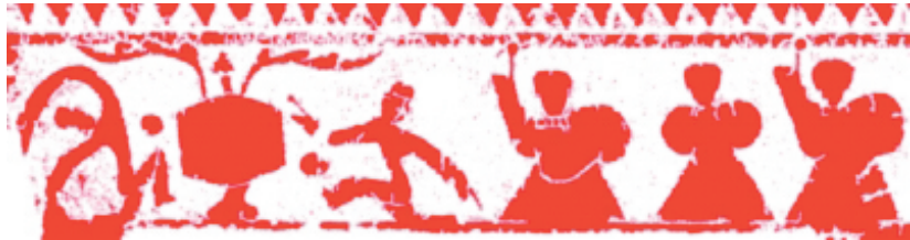
河南南阳汉画像馆藏“大鼓蹴鞠”画像石,左侧两人绕鼓蹴鞠,右侧三人音乐伴奏。

至于古代一般球迷,看球自然不可能像贵族那么讲究,但也是热门活动。宋朝时,球是民间流行的休闲娱乐活动,被当成“雅乐”,不看球的书呆子甚至会被人笑话。司马光《和复古春日绝句》诗称:“东城丝网蹴红球,北里琼楼唱《石州》。堪笑迂儒书斋里,眼昏逼纸看蝇头。”希望学子不要整天待在书房里死读书,也要抽空看看球。