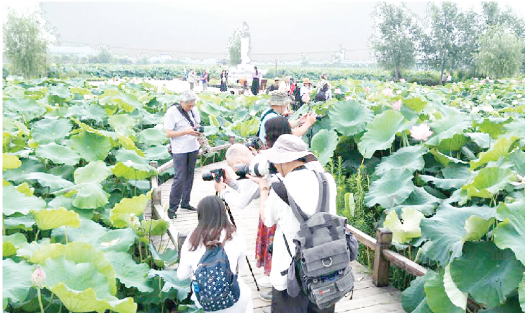
往届学员现场实践

光影中国网零基础摄影培训(初级班)第10期正在火热招生中,学员可随到随学,学会为止。授课方式以基础理论知识和摄影实用技巧为主,讲练结合,由光影中国网资深专业摄影讲师亲自讲课并指导创作,使学员能够轻松掌握摄影知识。