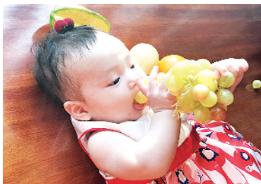
我也尝尝