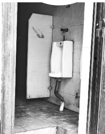
大门被破坏