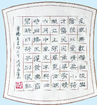
硬笔 侯鉴航 15岁