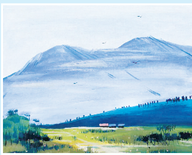
水粉 田星宇 9岁