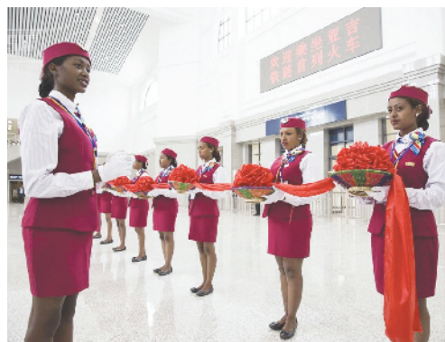
亚吉铁路通车(资料图片)