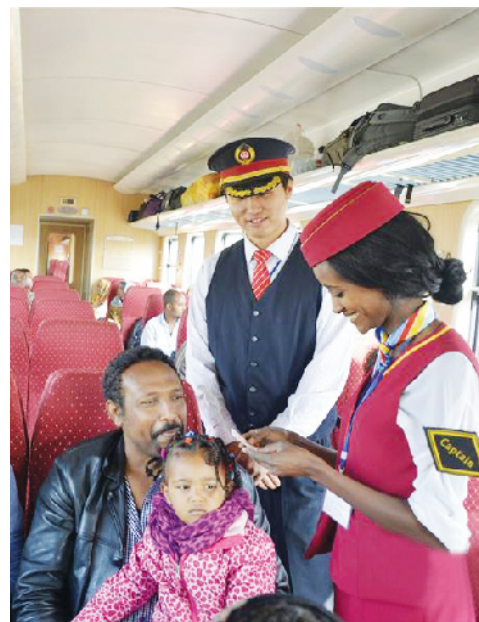
列车员在亚吉铁路一列列车上核实旅客车票(资料图片)