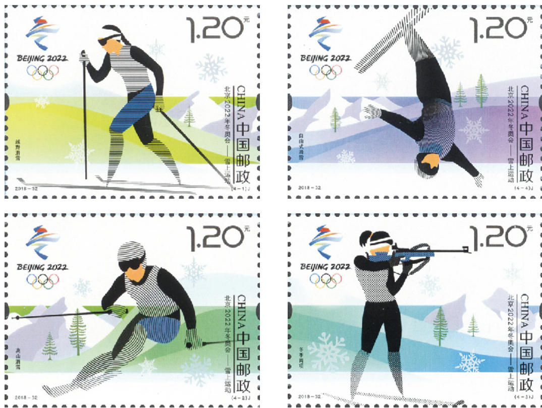
《北京2022年冬奥会——雪上运动》纪念邮票

中国邮政定于11月16日发行《北京2022年冬奥会——雪上运动》纪念邮票1套4枚,邮票图案名称分别为:越野滑雪、高山滑雪、冬季两项、自由式滑雪,全套邮票面值为4.80元。