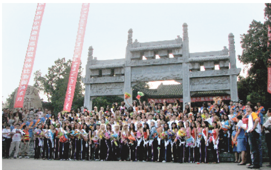
2007年世界旅游小姐巡游武侯祠