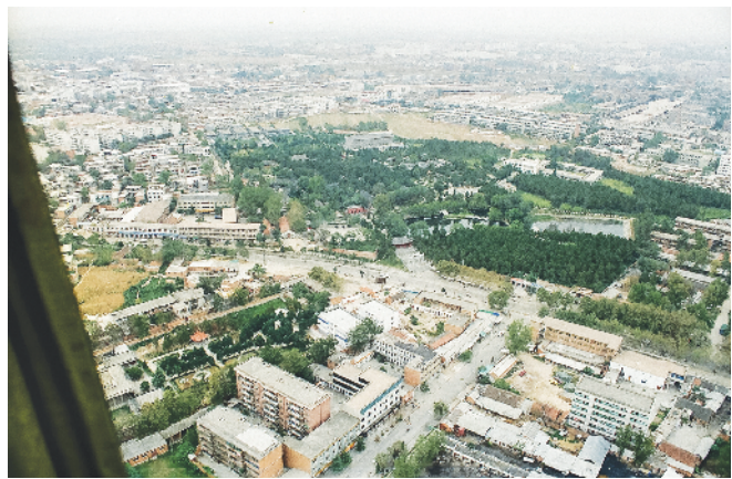
2000年卧龙岗航拍