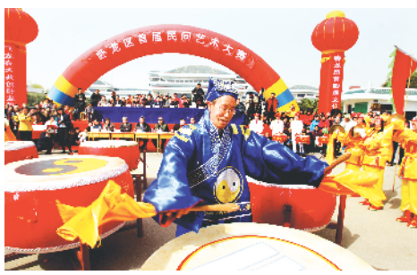
2010年汉画街卧龙区首届民间艺术大赛