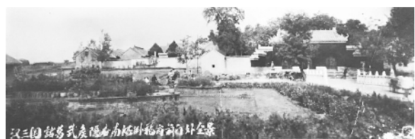
上世纪50年代卧龙岗