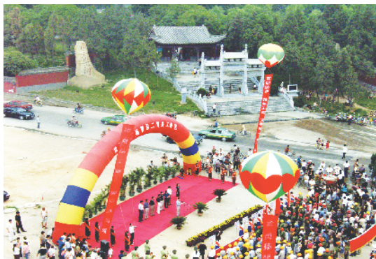
2005年开工建设武侯祠门前广场