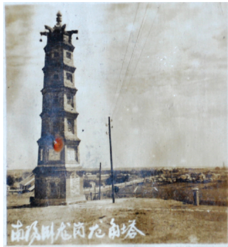
20世纪60年代,卧龙岗龙角塔