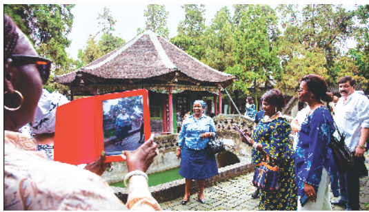
2012年多国友人游武侯祠