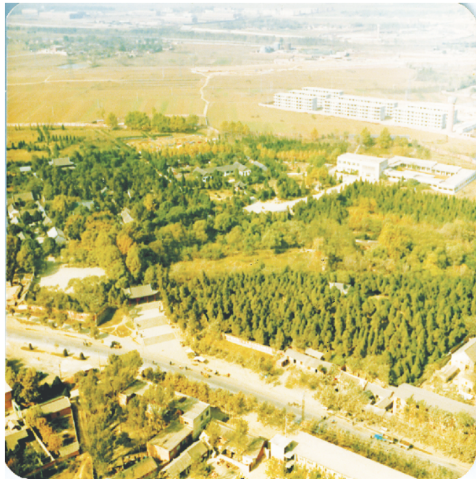
20世纪80年代卧龙岗