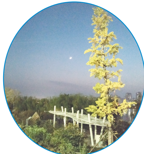
清风明月