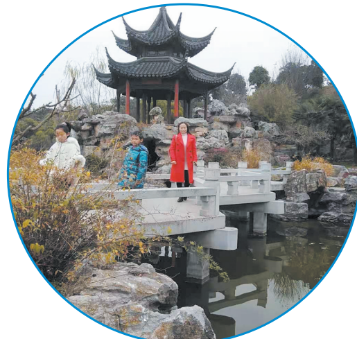
品味历史