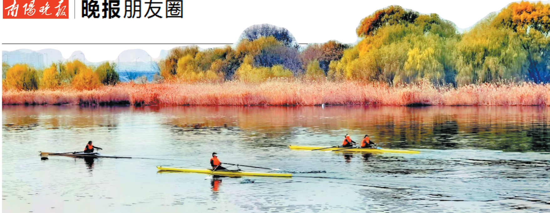
白河逐浪