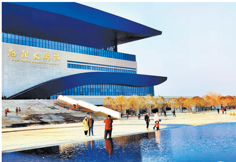
文化地标