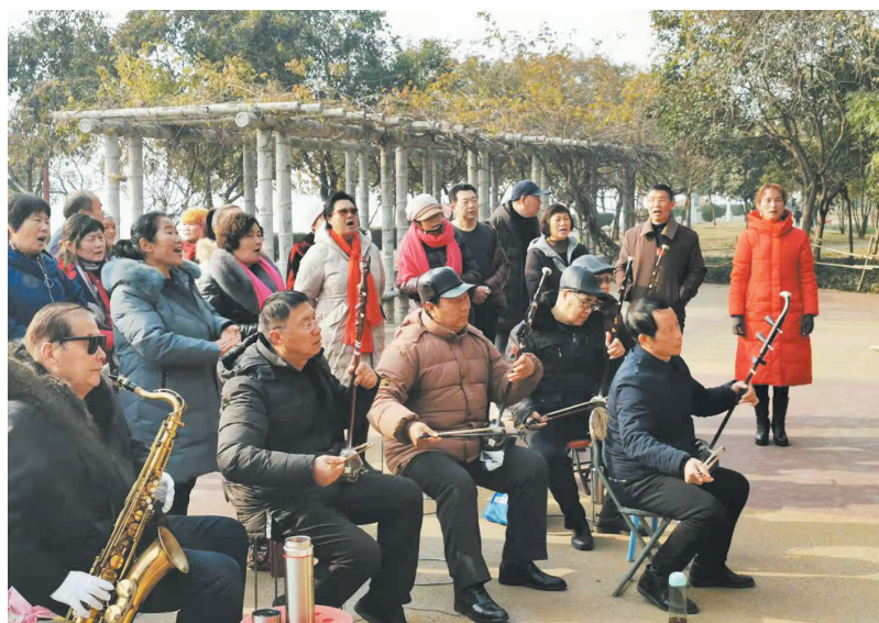
文艺荟萃