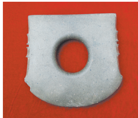
古曾国出土的钺,是军权、神权、政权、王权的代表

作,努力建设中国特色中国风格中国气派的考古学,更好认识源远流长、博大精深的中华文明,为弘扬中华优秀传统文化、增强文化自信提供坚强支撑。