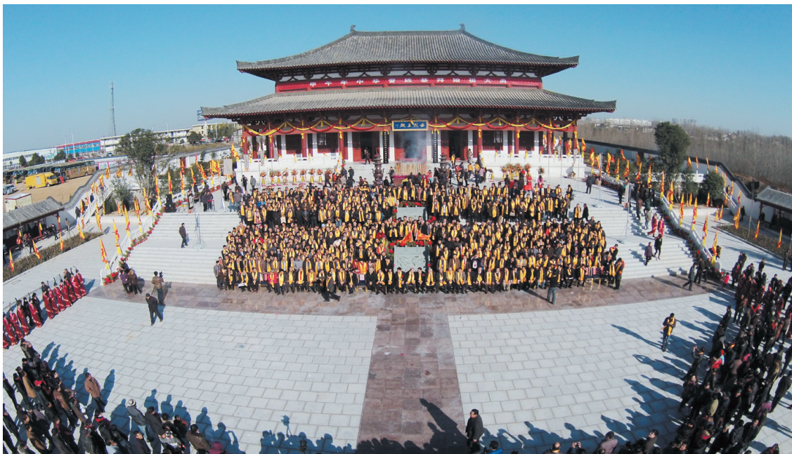
中华古缙国文化苑开园祭祖

2011年,中华古缙国文化苑项目在方城八里桥奠基,规划2000余亩地,引资10亿元,由方城县和河南省曾氏文化研究会、(新县)广宇房地产开发有限公司开发建设中华古缙国文化苑,来自台湾、香港地区和大陆各省市的曾氏宗亲代表为祖根地敬献培根土。通过中华古缙国文化苑项目建设,打造方城县