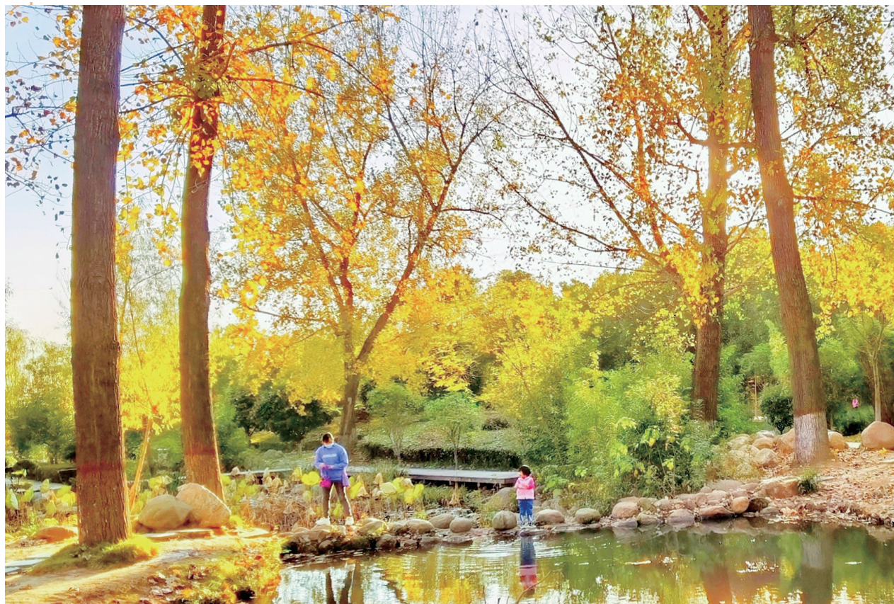
日照丛林

你的朋友圈有哪些感人的、有趣的、有特色的事,请以图片为主,配上百字以内的文字描述转发给我们,我们将择优刊登。