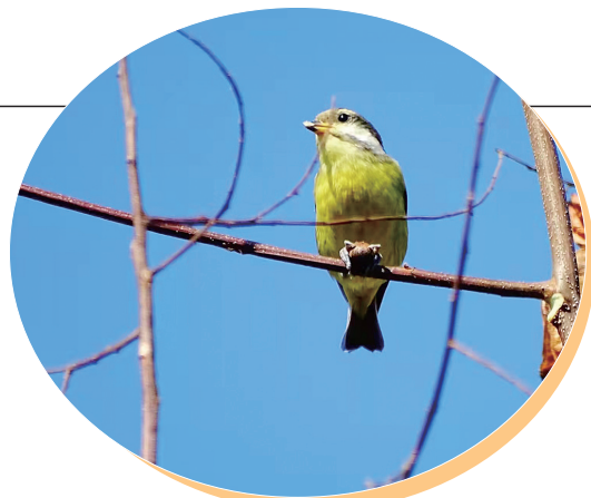
尽享时光

初冬时节,南阳城区的游园里,郊外的原野上,还有山村的树林中,数树深红出浅黄,一派斑斓的迷人景象。