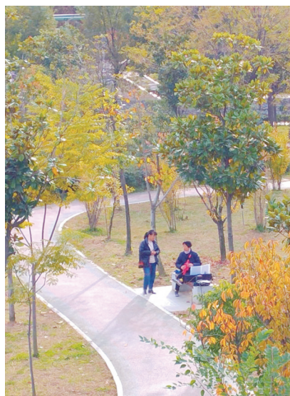
有声有色