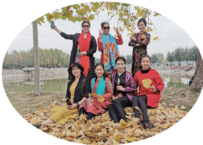
相约初冬