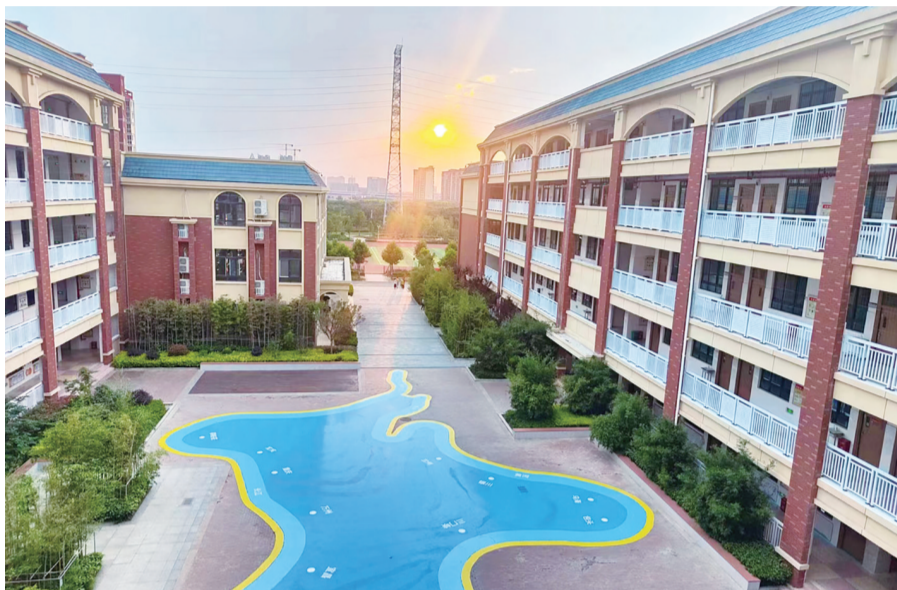
校内美景。