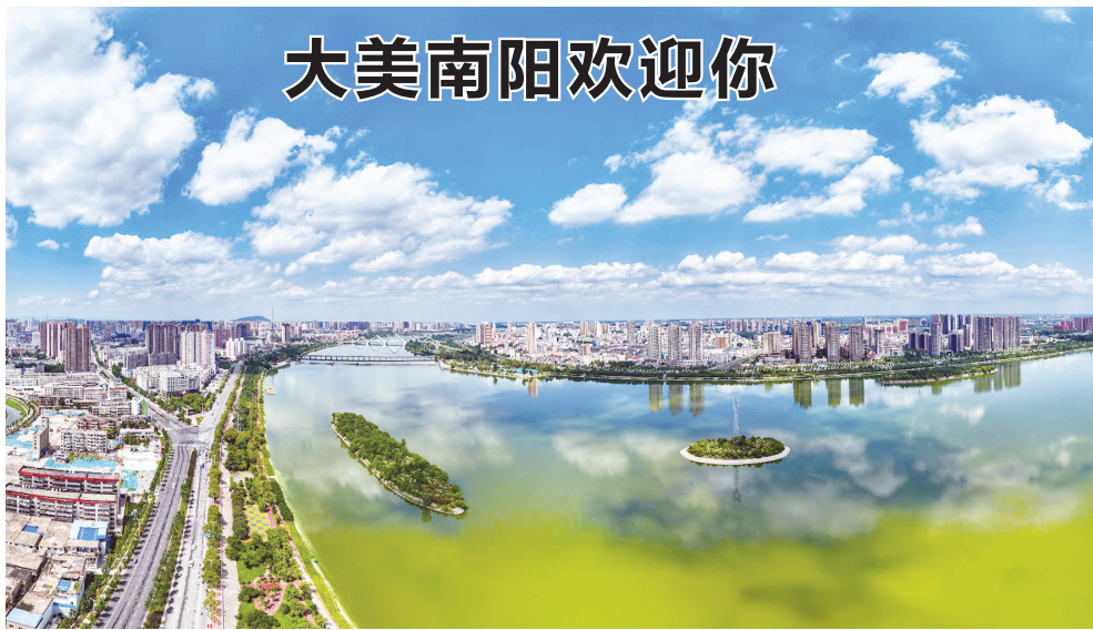
白河两岸风景如画 (资料图片)