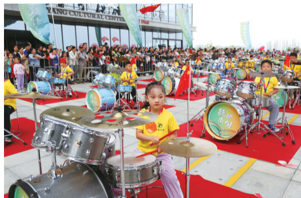
百鼓齐鸣

10月1日,东方水上元宇宙1周年庆典在白河槐香湾码头举办。红旗舞动,歌声飞扬,水面的游船、摩托艇在白河之上乘风破浪,围观的游客动情歌唱祖国,将现场气氛引向高潮。当日,我市的1000名小小架子鼓手们齐聚一堂,用百鼓齐鸣的方式,在市文化馆门前广场上奏响了一曲曲激昂的乐章,向祖国母亲献上最诚挚的祝福。③5