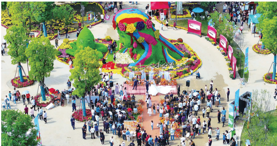
花仙子迎宾