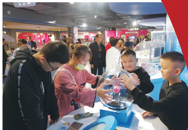
乐在其中