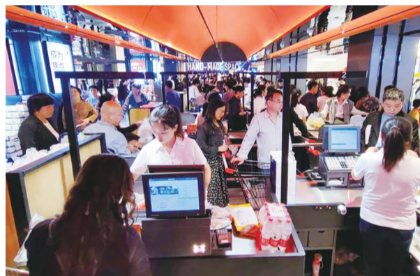
商场火爆