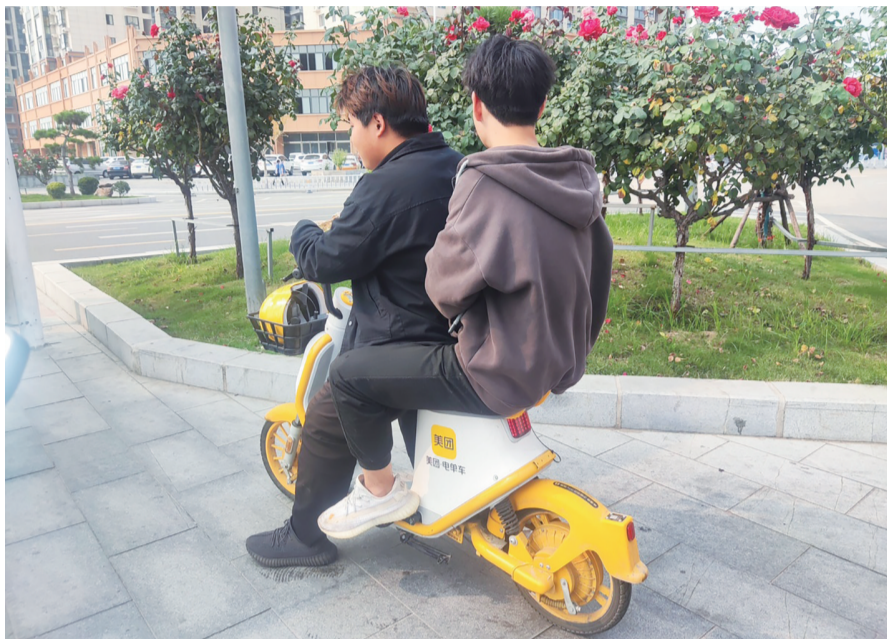
共享电单车不能这样“共享”

本报讯(记者 赵明禄 周梦)10月10日14时15分,记者在市城区孔明大道看到,两个男青年骑乘一辆共享电单车自东向西行驶,两人都没有佩戴头盔,一路摇摇晃晃,让人看了十分担忧。记者看到,这辆共享电单车上标有“禁止载人”的字样。