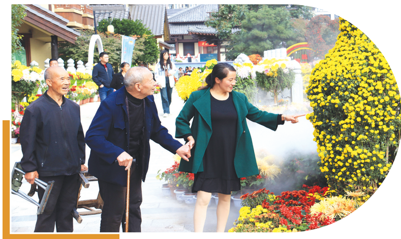
老人们在西峡仲景养生小镇赏菊花。

同吃长寿面、欢聚饺子宴、讲解重阳节习俗、开展重阳节传统民俗活动、组织文艺会演……精彩的活动营造出温馨祥和、其乐融融的节日氛围,也让“尊老、敬老、爱老、助老”的传统美德走进社区、小镇,走进每个人的心中。秋日艳阳下,老人们感受着满满的关怀,绽放出幸福的笑容。③9