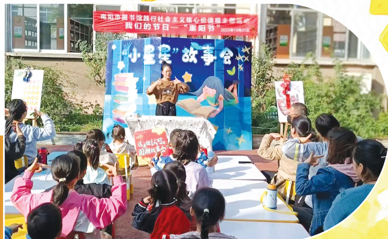
市图书馆开展重阳节主题活动。