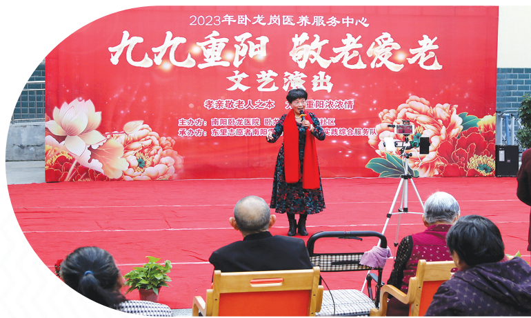
卧龙区卧龙岗街道汉画社区和南阳卧龙医院联合举办文艺演出活动。