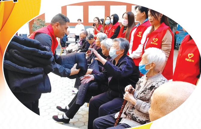
社旗县民政局为老人们送去慰问品和节日祝福。