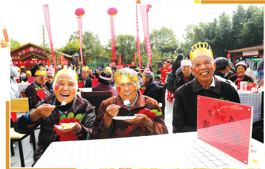
卧龙区卧龙岗街道黄龙庙社区65周岁以上老人欢聚一堂度佳节。