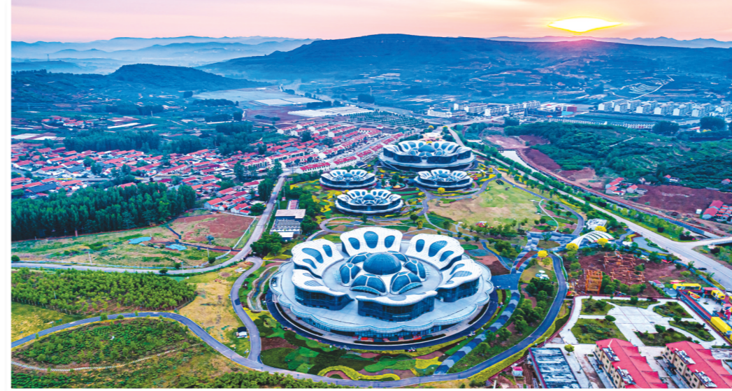
尹家峪醉美田园综合体

临沂市,古称琅琊、沂州,春秋时建启阳城,秦时属琅琊郡,汉代设临沂县,清设沂州府。思想家荀子、宗圣曾子、智圣诸葛亮、书圣王羲之、大书法家颜真卿和珠算发明家刘洪都出生或曾生活在这里,孔子72贤徒中有13人、历史上24孝中有7孝在这里。如今,有着丰厚历史文化底蕴的革命老区,在新时代绽放的不仅是红色的,更是多姿多彩的;不仅是传统的,更是时尚繁荣、走向未来的。漫步于银雀山汉墓竹简博物馆,体验《孙子兵法》《孙臆兵法》之奇绝;徜徉在王羲之故居,身临砚池怀古、曲水流觞,领悟书法真谛。千年历史文化,浓缩在这一处处文物故居和馆藏里,让人仰慕遐思。文化是一座城市的灵魂。临沂坚持以文塑旅、以旅彰文,唱响“山”的强音,做活“水”的文章,“释放”“城”的潜能,彰显“村”的魅力,塑造“人”的精神,全力推动文化旅游深度融合和高质量发展,也让“红色沂蒙·时尚临沂”的城市品牌形象日益深入人心。夜幕下的临沂,华灯初上,登上“水上巴士”,夜游沂河,看两岸高楼林立、流光溢彩,恍若江南