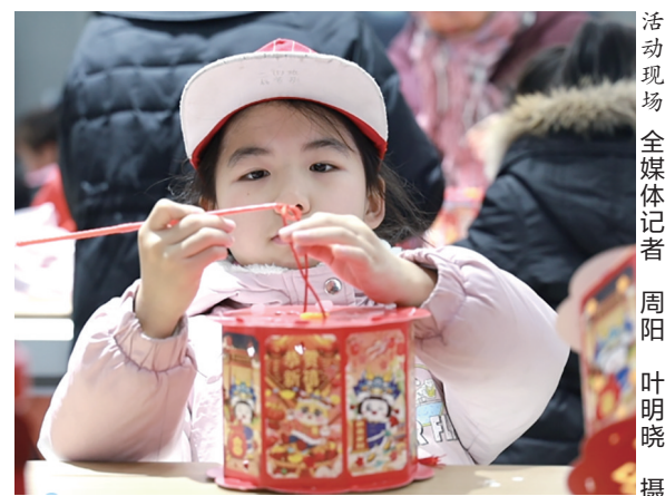
活动现场

本次活动由京东电器南阳城市旗舰店联合科大讯飞公司提供支持。除了诗词挑战,科大讯飞公司还提供了与未来对话体验项目,小记者们争先恐后与“爱因斯坦”探讨宇宙自然的奥秘,与“李白”对诗,甚至让“李白”根据自己名字现场写诗,与“梵高”一起进入五彩斑斓的图画世界,与“馨馨同学”比赛成