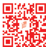
“群众呼声” 微信二维码