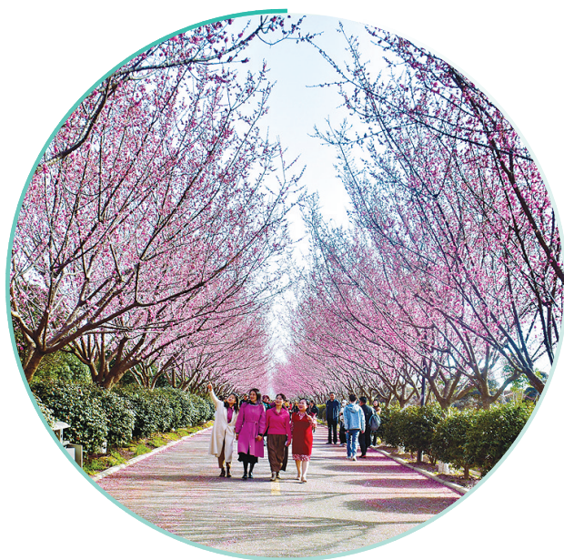
云蒸霞蔚梅盛开