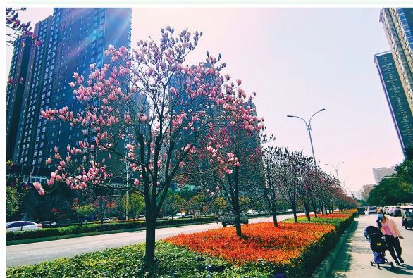
街头玉兰花正艳

街道旁、公园里,玉兰花也悄然绽放枝头,为城市增添了一道亮丽的风景线。你瞧,一朵朵玉兰花竞相开放,清新的花香扑鼻而来。在梅城公园,市民周女士带着父母、孩子到公园赏花,并时不时掏出手机定格美丽瞬间。“春天真美,各种花赶趟似的,让人目不暇接,带全家人一起来感受一下春日美景。”周女士说。③4