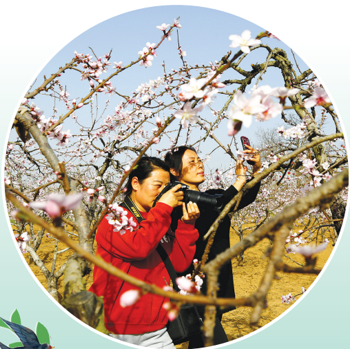
三月桃花开满枝