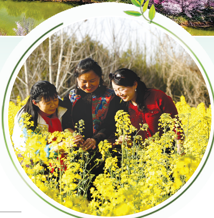
一片金黄美不胜收