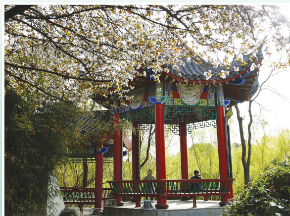
春景如诗游人醉