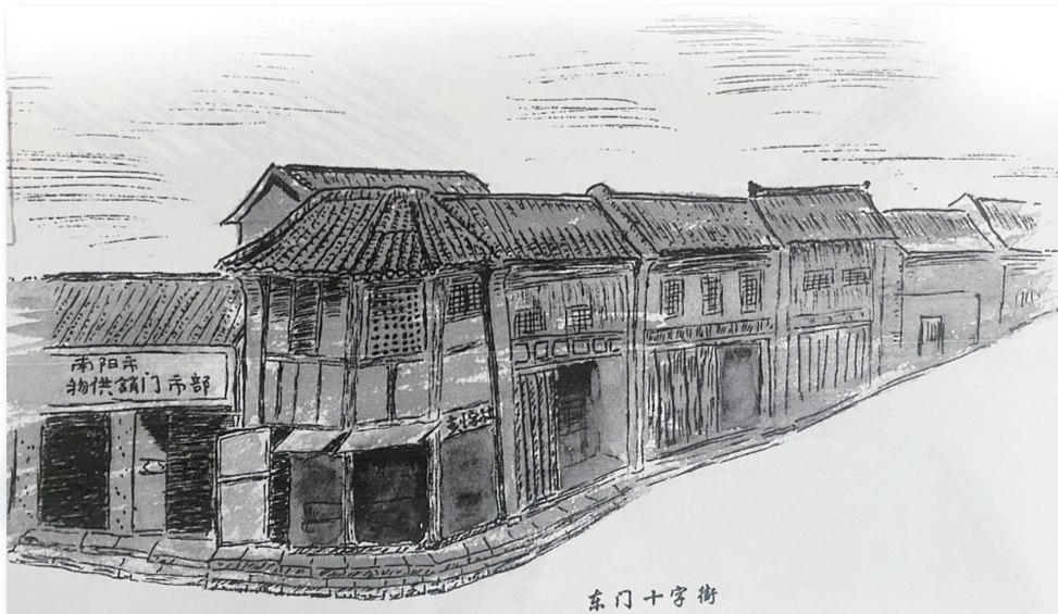
旧时南阳东门十字街 吕凤林 绘