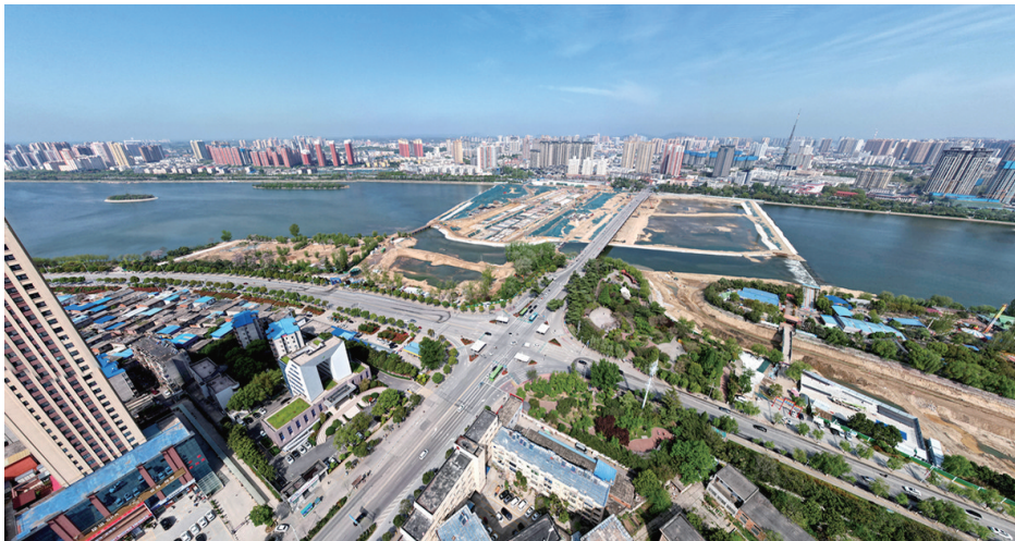
鸟瞰卧龙大桥周边区域

本报讯(记者 张玲)自4月10日0时起,卧龙大桥开始全封闭施工,过往市民如何出行?4月9日,记者采访有关部门了解到,卧龙大桥施工期间,市公安局交通警察支队对周边道路的交通管理措施进行了调整,全力确保道路交通顺畅。