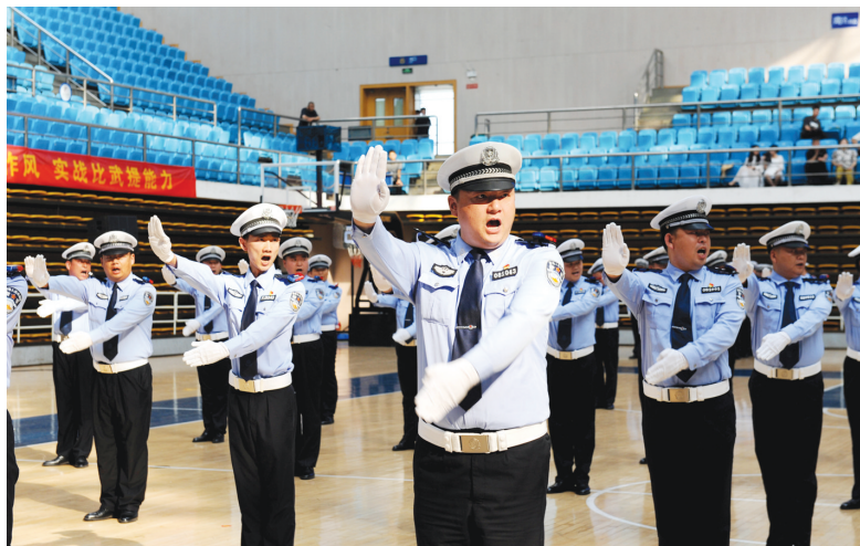
比赛现场

市公安局交通警察支队相关负责人表示,通过比赛,磨炼了基层民警辅警的顽强意志,增强