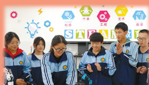
趣味盎然的智能机器人体验课