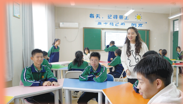
丰富多彩的心理健康教育课