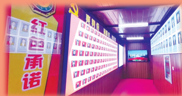
市八中“红色文化”教育基地——学校党史馆