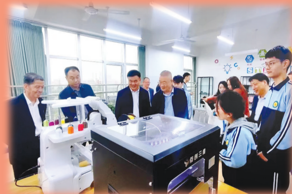
市区领导观摩八中学生“3D”智能打印作品