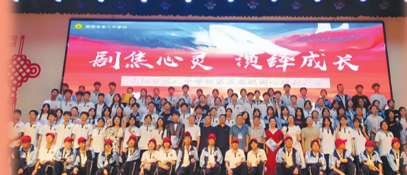
市八中第五届心理剧大赛合影留念