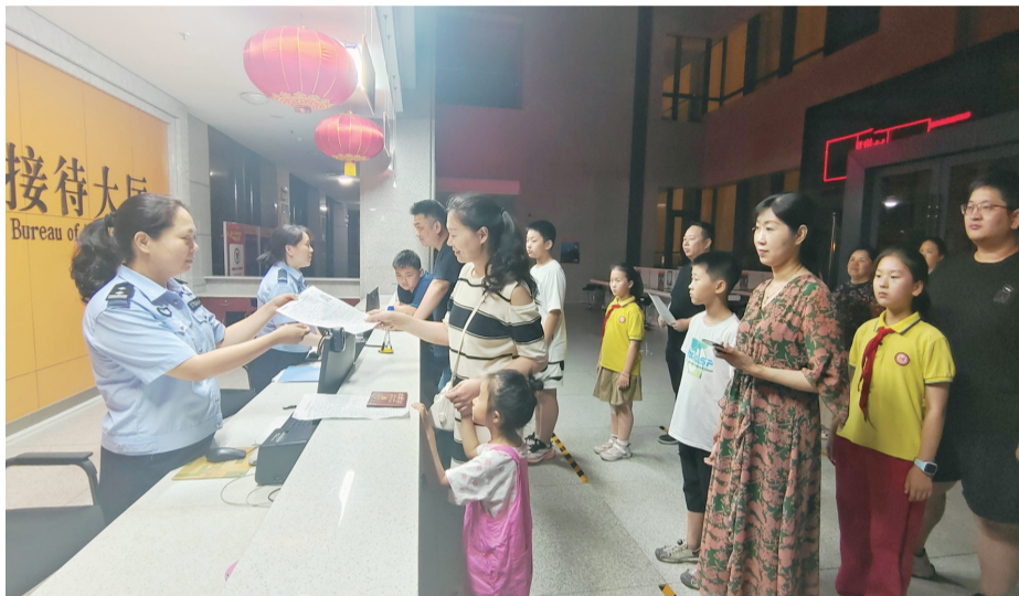
夜间办证现场,市民有序排队办理。

随着中高考结束和暑期来临,目前市公安局出入境接待大厅迎来了新一轮办证高峰。针对暑期办证办事量明显增加的情况,市公安局出入境管理支队实施多项便民举措,开设暑期出入境办证夜间专场。