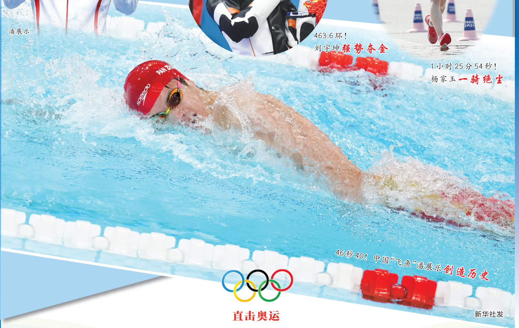
46秒40! 中国“飞鱼”潘展乐 创造历史