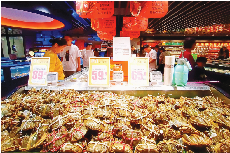
新鲜的螃蟹布满展台

中秋节当天,还是有很多市民购买螃蟹。“中秋节后客流量趋向平稳,部分品种的螃蟹价格比节前有所下降。目前,市场上苏州大闸蟹每只降了 10 元左右。”