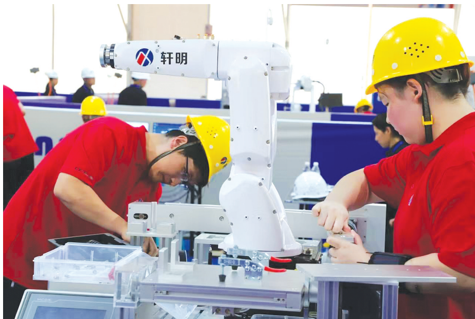
对机器人进行安装调试