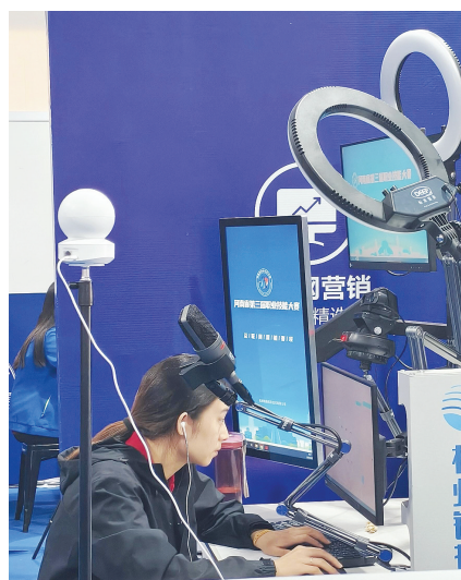
紧盯电脑屏幕操作