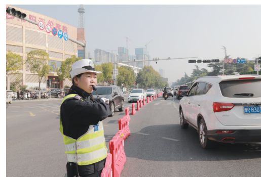
疏导交通

交警部门提醒,除了提前绕行外,过往群众可选择绿色出行、错峰出行等方式。他们也将不断收集广大群众的意见建议,实时调整优化交通管控保畅措施,满足群众出行需要。同时,希望过往群众按交通指引标识通行,服从交警和现场管理人员的指挥,合理安排出行。③7