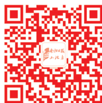
扫码关注公众号 了解更多活动信息

可关注“南阳日报小记者公众号”或拨打电话0377-63183558(工作时间),了解大赛详细事宜。③6