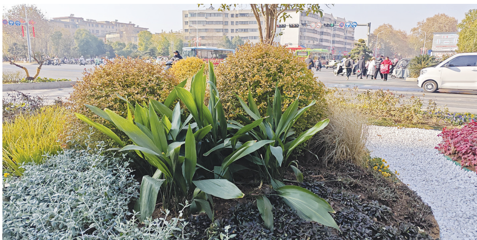
仲景大道绿化带提升

本报讯(全媒体记者 赵洋)2024年12月31日,记者走访中心城区仲景大道和伏牛路绿化带提档升级现场,了解施工进度。