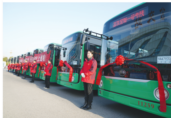
新投运车辆

本报讯(记者 于晓霞)2024年12月31日,50辆新能源纯电动公交车向城区投运,同时“南阳公交”App正式上线,进一步提升市民的乘车体验,让市民出行更高效、便捷。