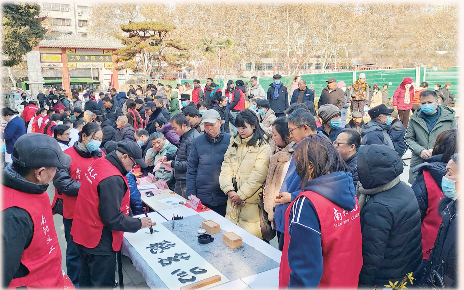
1月10日，南阳日报社“党媒帮忙团”走进宛城区东关街道西拐社区，市义工联擅长书法的爱心志愿者也来到活动现场，将满载深情与祝福的书法作品送给市民。③5