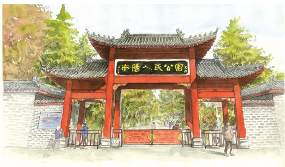
手绘作品《南阳人民公园》