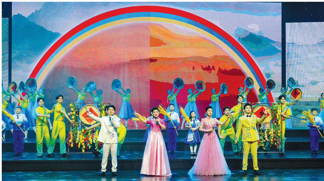
歌唱好生活

祥龙摆尾辞旧岁,金蛇纳福迎新春。1月23日,“奔向新辉煌”2025南阳春节电视文艺晚会在南阳广播电视台演播大厅精彩上演。悦耳的歌曲、欢快的舞蹈、令人捧腹的相声、韵味十足的地方戏曲,为观众营造出阖家团圆的美好气氛,凝聚起全市团结向上、同心逐梦的坚定信心和磅礴力量。