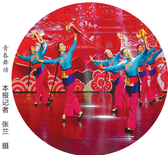
青春舞动

此次活动不仅丰富了村民的精神文化生活,更让村民在文明欢乐的氛围中赏民俗、品文化、寻年味,在家门口就能感受到浓郁的年俗文化和淳朴的乡情韵味。③④