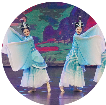
古风汉韵

在歌舞《为幸福奋斗》的优美旋律中,晚会缓缓落下帷幕。但是,观众的热情持续不散,现场气氛依旧“沸腾”,掌声、欢笑声久久回荡……③④