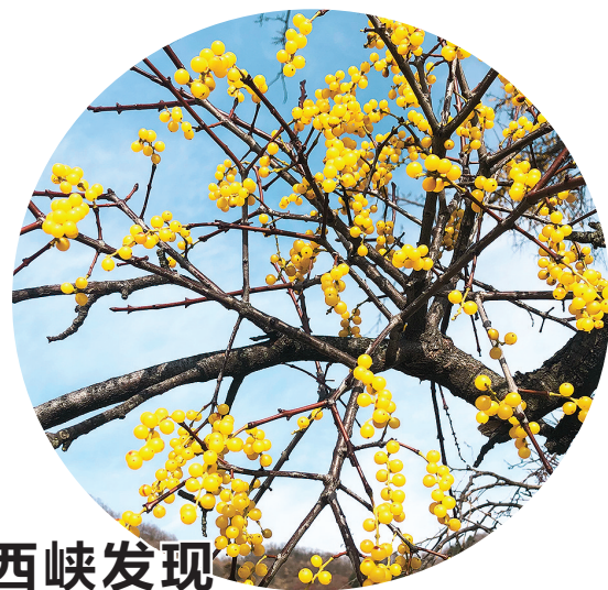
北桑寄生

此次活动也让很多家长十分开心。小记者家长李女士说,现在这个时代,人工智能日新月异,希望在学习之余,让孩子更多地了解前沿科技,感悟科技带给世界的变化,逐步学会利用最新的技术和工具,在未来的学习生活中保持竞争力。③7