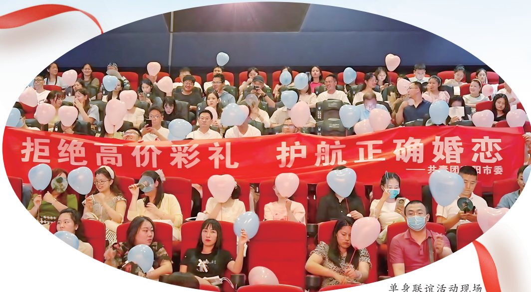
单身联谊活动现场 (资料图片)

当传统婚恋机构还在线下厮杀时,“南报红娘”已率先开辟线上赛道。2024年5月推出的“微相亲·最美时节带TA回家”线上单身联谊会,创造性地引入短视频自荐、大数据匹配功能,红包雨、连麦告白等环节让云端相亲既有趣又高效。2024年七夕节更与影城联动打造“观影+约会”沉浸式体验,8分钟轮转换座设计令匹配成功率极大提升。