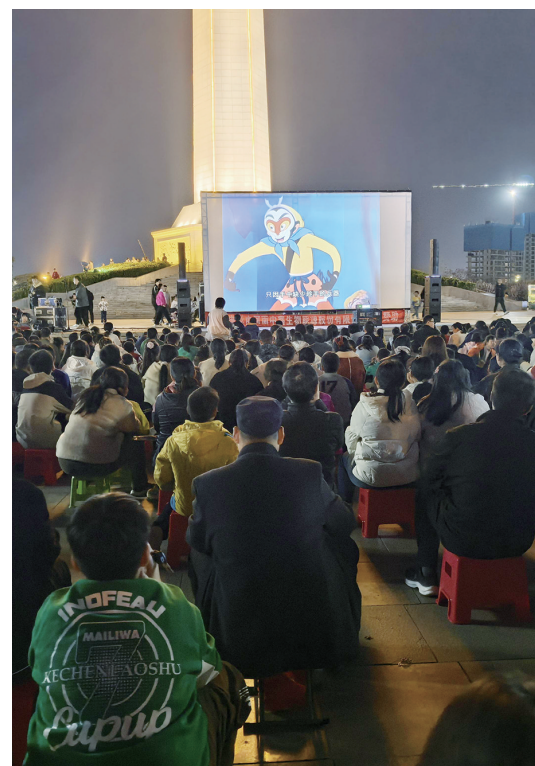
感受经典

据悉,第三届世界月季博览会将于4月26日开幕,露天公益电影放映活动将持续至开幕前,每周五或周六晚上举行。活动不仅为市民提供了一个休闲娱乐的好去处,更让人们在轻松愉快的氛围中感受到城市文化的温度。③4