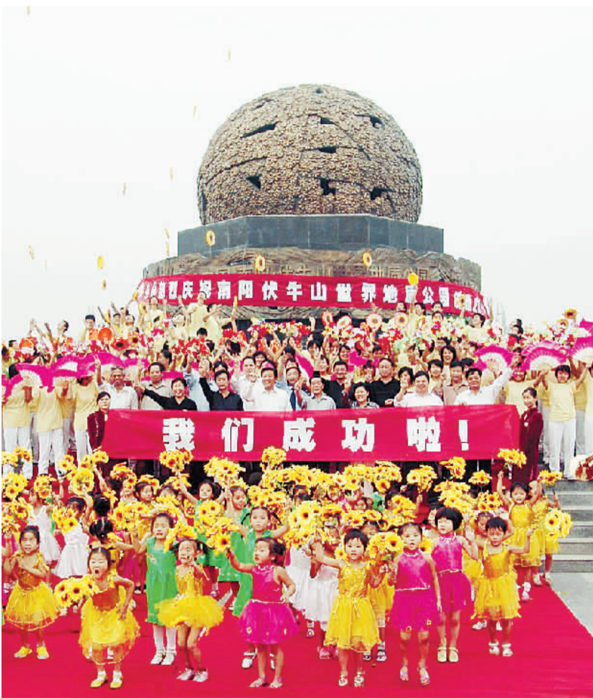
2006年9月19日，社会各界欢聚内乡地质广场，庆祝南阳伏牛山世界地质公园创建成功。

莽莽八百里伏牛山，像一条巨龙俯卧于神州大地中央，它揭示了古中国28亿年的地质演化过程，架构了亚热带北缘的地理分界