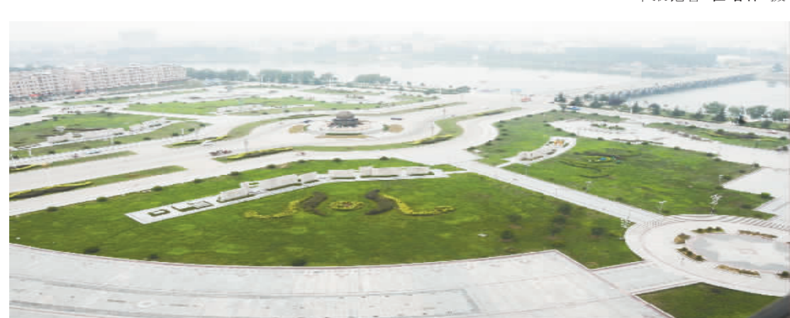
壮观的内乡主题碑广场