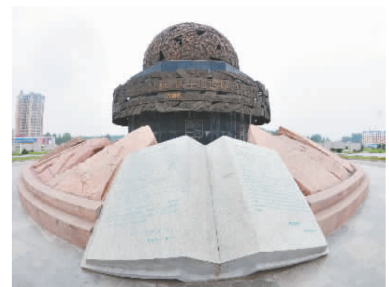
用青铜和花岗岩铸就的“地质书”