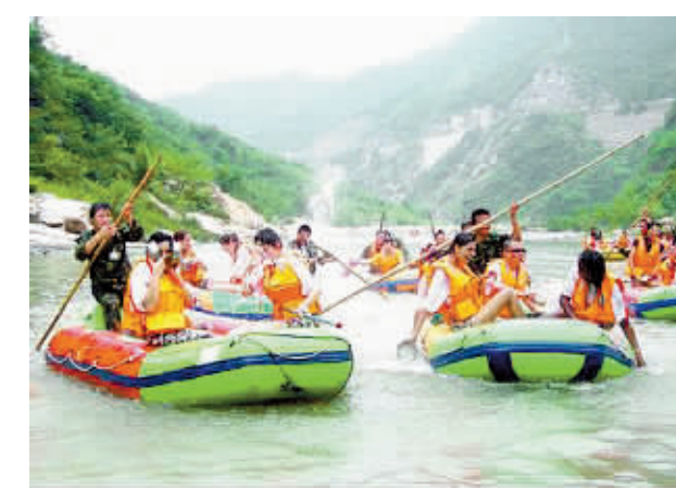
惊险刺激的中原第一漂