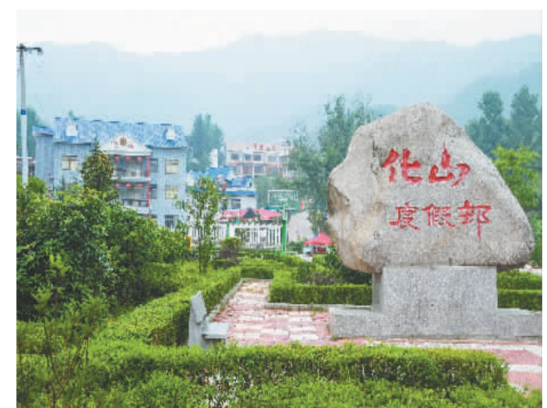
闻名遐迩的化山度假村