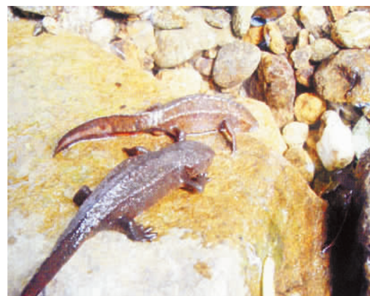
“活”的古生物化石”娃娃鱼