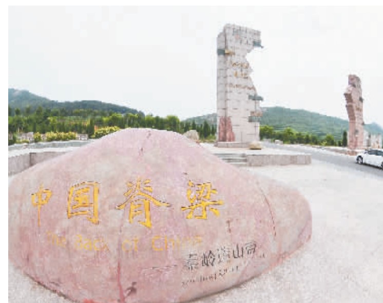
伏牛山地质公园——马山砦地质广场