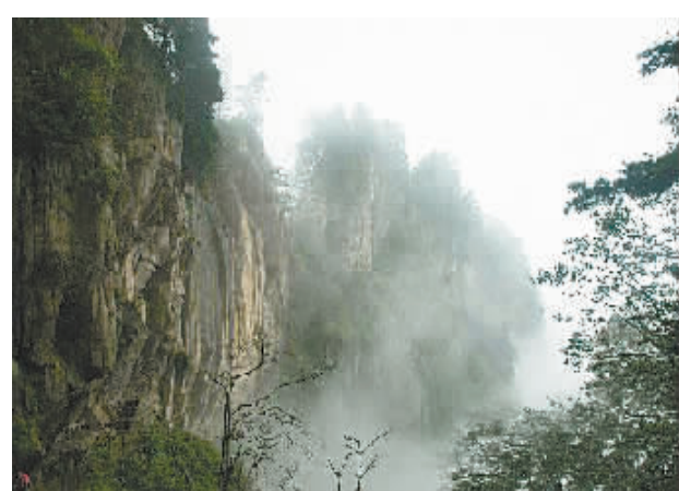
秀丽神秘的宝天曼风光