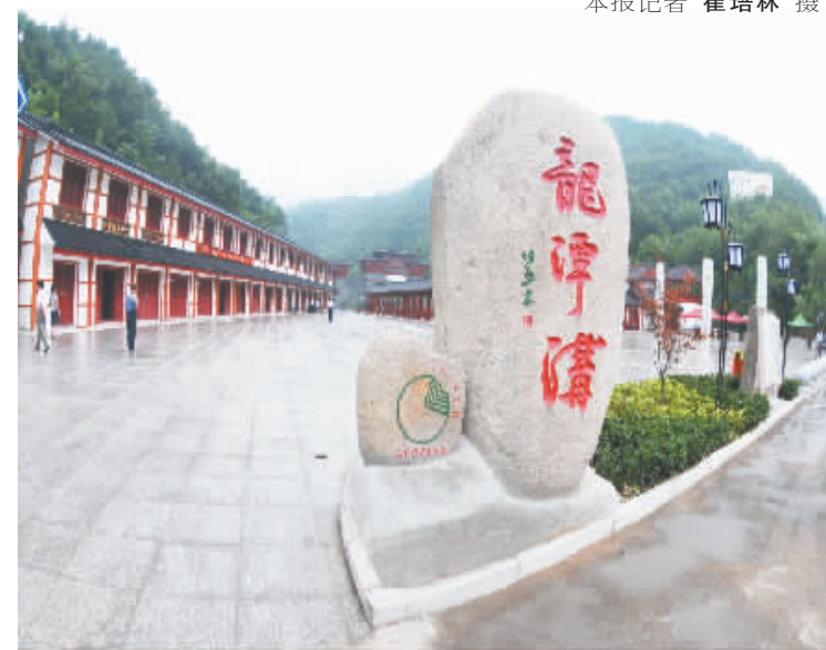
设施完备的龙潭沟景区