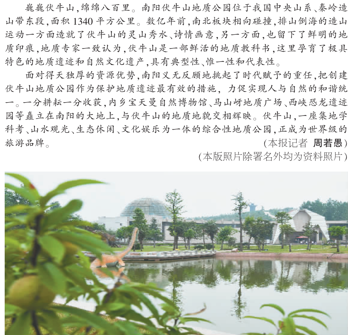
迷人的西峡恐龙遗迹园