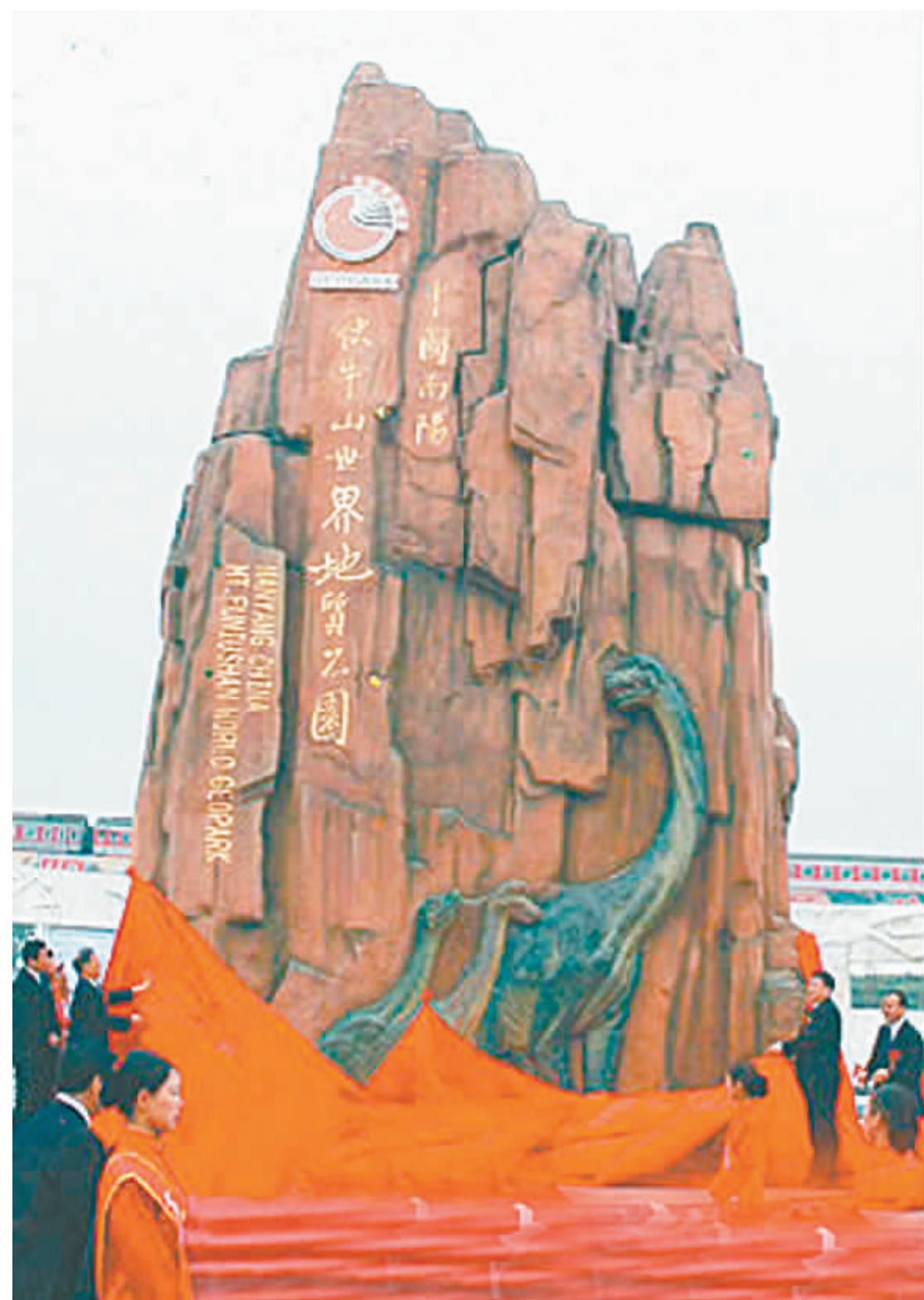
中国·南阳伏牛山世界地质公园揭牌