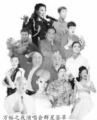
万裕之夜演唱会群星荟萃

二十多年穿梭于文化积淀深厚的伏牛山区域,使他总是用独特的东方美学意境,表达对宇宙、对人生的思考。他创作的远古神话系列油画作品,融入了两千年前汉代画像石刻古朴拙美的造型,充溢着人类源于抔泥、归于黄土的哲学内涵,画面空间遥远混沌,带给人无限的遐想。⑤5