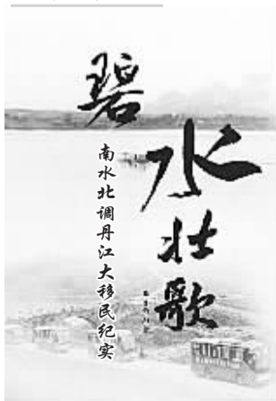
刘正义 水兵 著

对提前来看房子的浙川移民群众,仔细地询问他们对政府的安排还有什么意见,一浙川移民高兴地看一排排和城市社区无异的两层小楼,指着悬挂在大门上的横幅,念道:丹江碧水一线牵,社旗浙川心相连。只要我们的房子建得和三峡移民的那样,我们就很满意!李天岑说,请你们放心,我们设计、建筑的新居绝对要超过三峡移民!有一位年龄稍大的移民吞吞吐吐地说,李主任,我有一个意见,不知道当说不当说?李天岑说,我们就是来听取大家意见的,有啥你就说吧!那位老农说,俺们最大的意见是不愿在屋子里解大手,不如俺原先那土茅