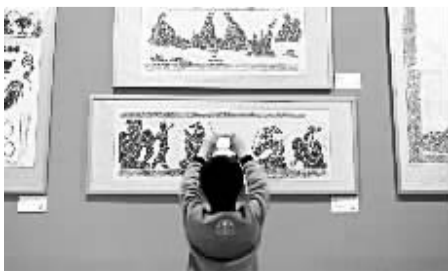
首都观众陶醉南阳汉画